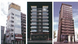
清川営業所 福博ビル